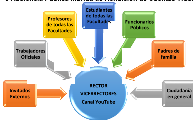
Imagen N° 6 Audiencia Pública híbrida de Rendición de Cuentas Tradicional