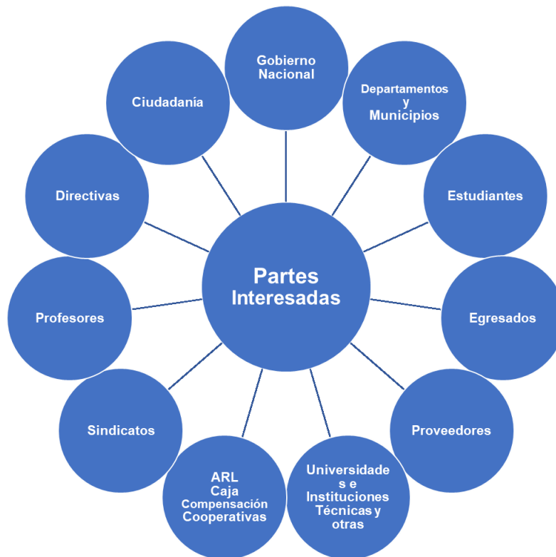
Imagen N° 5 Caracterización partes interesadas Rendición de Cuentas UPN

Las partes interesadas según su rol, tienen necesidades y expectativas que, en la gestión institucional permanente, la UPN, responde de manera satisfactoria a las mismas, fortaleciendo y promoviendo mayor y más efectiva participación de los grupos de interés.